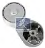
Riemspanner 4.63774 · repl. Mercedes 906 200 1270