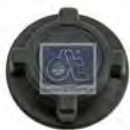
Deksel, expansietank DT 2.15321 · repl. Volvo 1674043