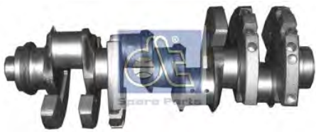
Krukas, zonder lager 4.61226 · repl. Mercedes 402 030 3201