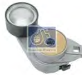
Riemsprenger DT 2.15223 · repl. Multibrand