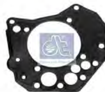
Pakking, versnellingsbakbehuizing 4.20515 · repl. Mercedes 945 261 0080

Aanwijzingen: Tijdsgebonden aanbiedingen gelden slechts zolang de voorraad strekt. Tussentijdse verkoop voorbehouden. Onze Algemene Verkoops-, Leverings- en Garantievoorwaarden, die u op onze Website kunt downloaden, zijn van toepassing. Alle prijzen zijn nettoprijzen exclusief BTW. Vergissingen voorbehouden. Referentienummers van de voertuigfabrikanten zijn vrijblijvend en duiden niet op hun oorsprong. Ze mogen op rekeningen niet doorgegeven worden. © DIESEL TECHNIC. DT® – een merk van DIESEL TECHNIC, Duitsland · IR 544 194, IR 918 804, CTM 002 591 113, CTM 009 307 265.