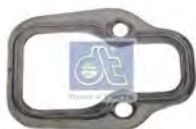
Pakking, inlaatspruitstuk 4.20213 · repl. Mercedes 442 141 1780