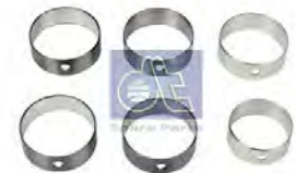
Nokkenaslagerset DT 2.91551 · repl. Volvo 8192678 S