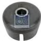
Binnenring, veerschommel DT 2.62071 · repl. Multibrand