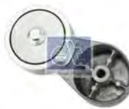
Riemspanner 4.64246 · repl. Mercedes 906 200 2670