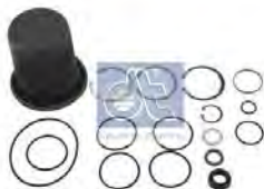
Reparatieset, dempcilinder DT 2.93319 · repl. Volvo 3097070