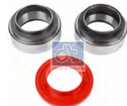
Lagerset Ø 94 mm DT 2.96207 · repl. Multibrand

Aanwijzingen: Tijdsgebonden aanbiedingen gelden slechts zolang de voorraad strekt. Tussentijdse verkoop voorbehouden. Onze Algemene Verkoops-, Leverings- en Garantievoorwaarden, die u op onze Website kunt downloaden, zijn van toepassing. Alle prijzen zijn nettoprijzen exclusief BTW. Vergissingen voorbehouden. Referentienummers van de voertuigfabrikanten zijn vrijblijvend en duiden niet op hun oorsprong. Ze mogen op rekeningen niet doorgegeven worden. © DIESEL TECHNIC. DT® – een merk van DIESEL TECHNIC, Duitsland · IR 544 194, IR 918 804, CTM 002 591 113, CTM 009 307 265.