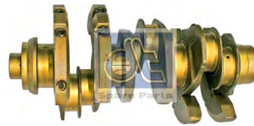
Krukas, zonder lager 4.62306 · repl. Mercedes 401 030 2501